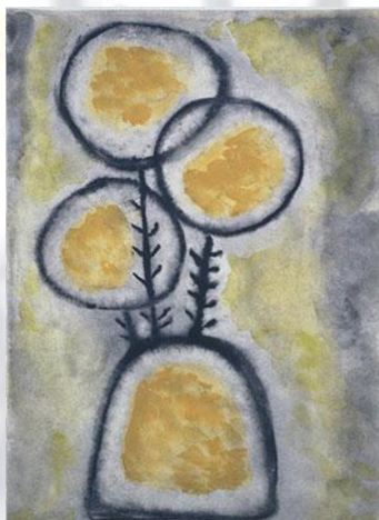
"Trois fleurs jeunes" © Mercè Rodoreda, VEGAP, Barcelona, 2018.

Sala Prat de la Riba Institut d'Estudis Catalans Carrer del Carme, 47 BARCELONA